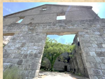
魚雷発射場施設跡地