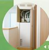
◀ 実物のロスガード90